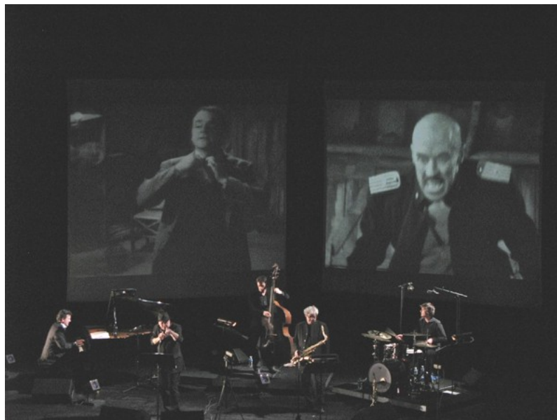
Films noirs - 2010